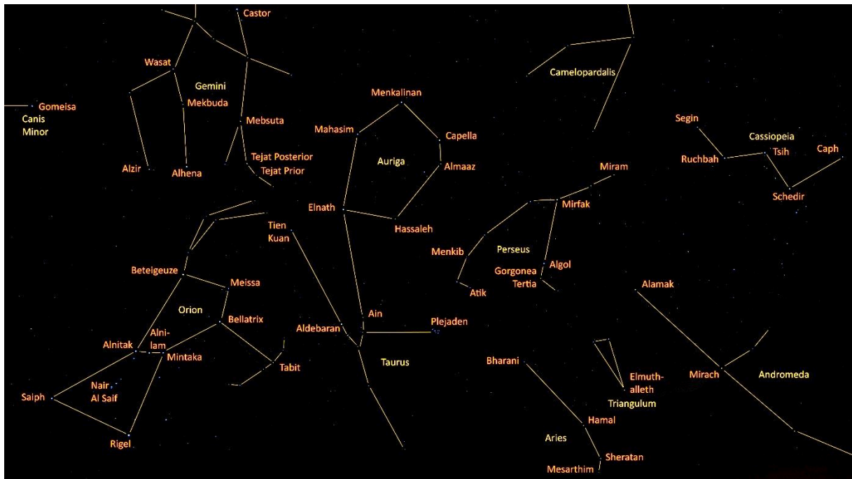
Abb. 1 Eine Astrophotografie der Himmelsregion von Orion, Taurus, Perseus, Cassiopeia mit heutigen Sternbildern.

Die Tierkreiszeichen bezeichnen die zwölf gleich großen 30°-Abschnitte der Ekliptik, die durch Aufteilung des Zodiaks (deutsch „Tierkreis“) gebildet werden. Die Ekliptik ist die Ebene, in der die Erde die Sonne umkreist. Gleichzeitig ist sie auch die gedachte Bahn, auf der sich die Sonne im Laufe eines Jahres scheinbar vor dem Hintergrund der Sterne bewegt – zumin-