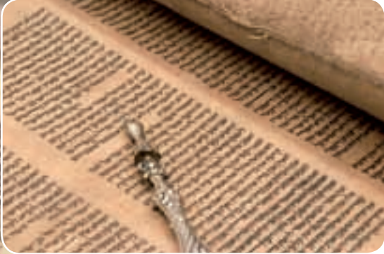
Meilensteine der Überlieferung des Alten Testaments Bibelfunde aus Qumran, hebräische Schriftrollen