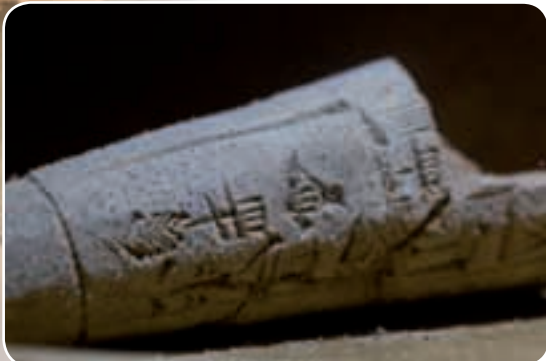
Die ältesten Schriften im Nahen Osten Keilschrift, Hieroglyphen, Alphabete, Schreibmaterialien