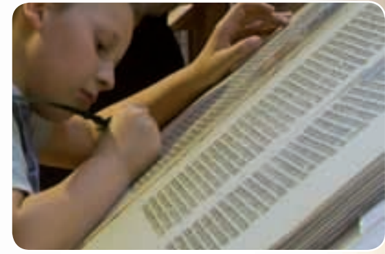
Wertvolle Handschriften Lateinische Bibel (Vulgata), Prachthandschriften, Armenbibeln, Blockbücher