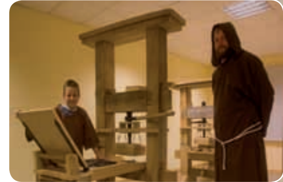
Die Bibel – das erste gedruckte Buch Gutenbergpresse, Gutenbergbibel, Inkunabeln Mitmachangebot: Buchdruck wie Gutenberg