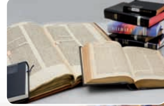
Die Bibel – ein Buch für die Welt Lutherbibel, Dienerberger Bibel, Übersetzungen in 900 Sprachen